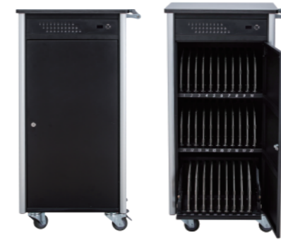
30埠智慧型充電推車 USB SUMR30 | USB Type C SCMR30