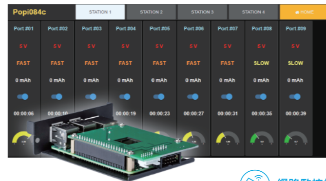
Po-Pi 充電遠端管理模組 Po-Pi Module