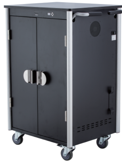
40埠智慧型AC行動充電車 SEM40-K