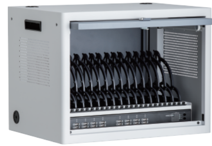
16埠智慧型 USB 充電系統櫃 SUMF16