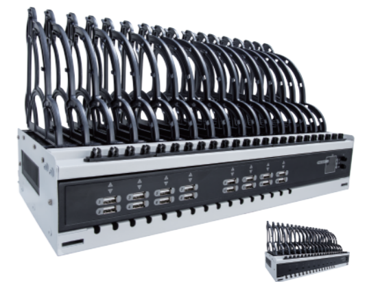
智慧型充電書架系統 USB SUMP16-1 | USB Type C SCMF10-1