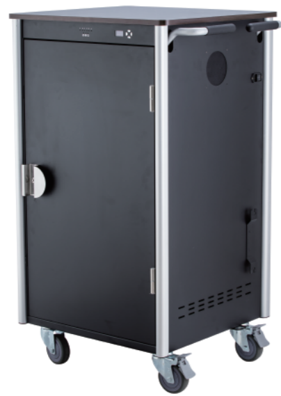
30埠智慧型AC行動充電車 SEM30-K