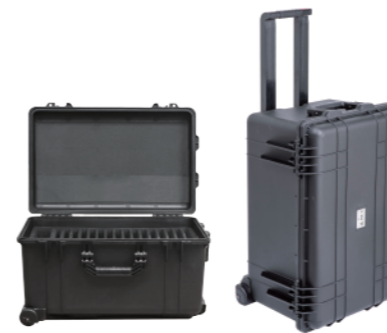
智慧型多功能充電防水箱 USB SUMW16 | USB Type C SCMW10